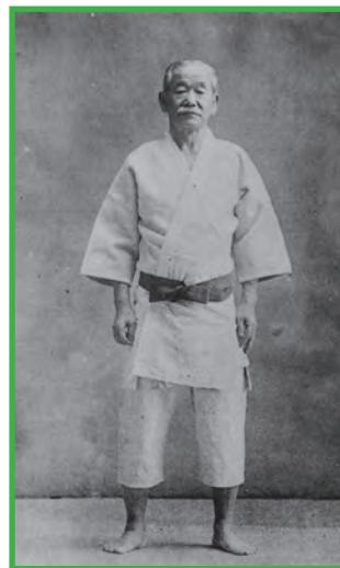
J. KANŌ in Shizentai

Shizentai ist eng verknüpft mit dem „richtigen“ Fortbewegen auf der Matte, dem Shintai („gehen“) und dem Tai-sabaki („sich drehen“). Der Körper sollte hierbei stets aufrecht gehalten werden, die Füße in der Nähe der Matte bleiben und der Oberkörper zentriert über der Stützfläche gehalten werden. Pendeln oder wippen des Oberkörpers sind unter allen Umständen zu vermeiden, weil der Gegner dies nutzen könnte, um