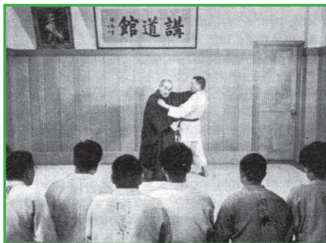
J. KANŌ erklärt Kuzushi

Bereits in seinem Vortrag von 1889 (vgl. Teil 4) erläutert KANŌ, dass man einen Gegner umso leichter werfen kann, je kleiner die Fläche ist, die sein Körpergewicht trägt. Wichtig sei es also, den Gegner vor einer eigentlichen Wurfaktion durch geschicktes Manövrieren dazu zu bringen, sein Gewicht entweder auf die Fußballen, auf die Fersen oder auf einen Fuß - und